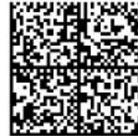
Tax Invoice 255650